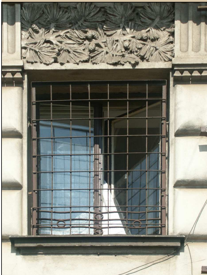
okno v jižním průčelí – vnější strana