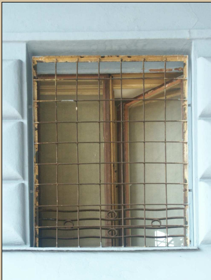
okno ve východním průčelí – vnější strana